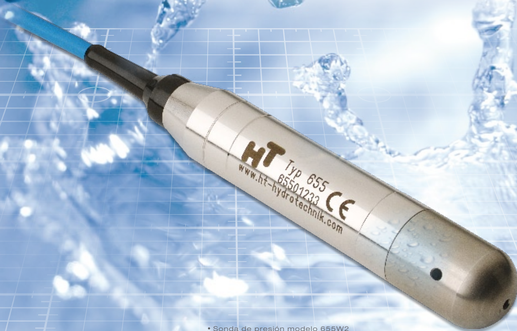
• Sonda de presión modelo 655W2